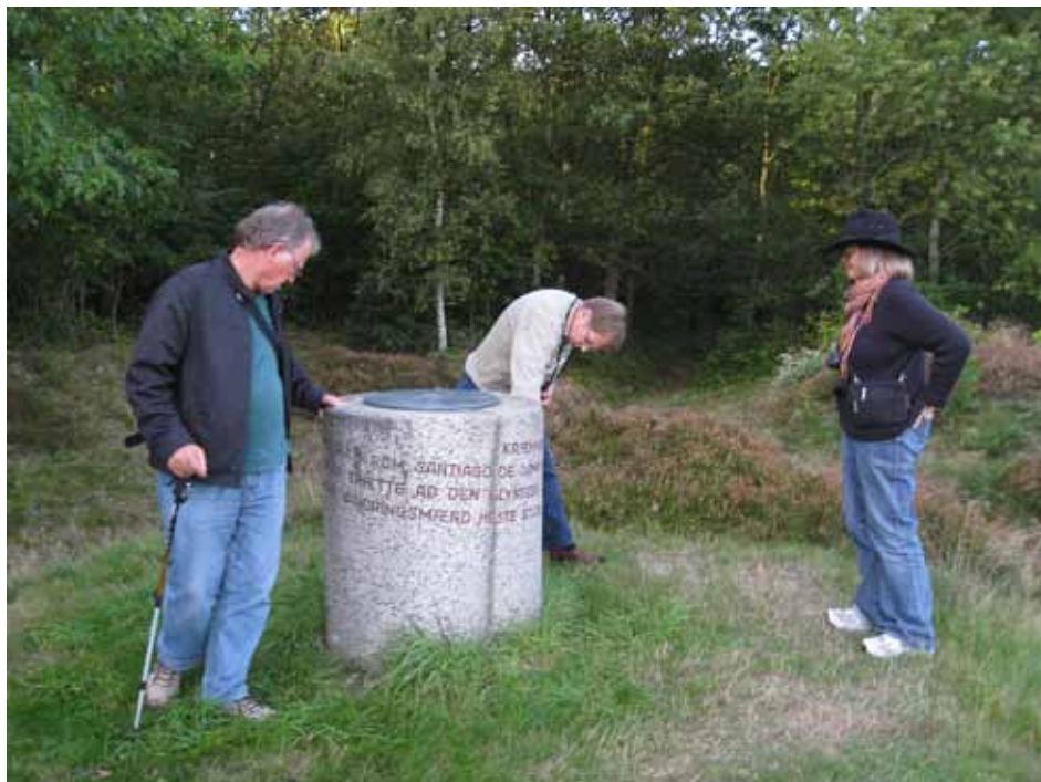
På sporet af Norden: Vandrere ved Hærvejsstenen syd for Viborg.

mer, og der er plads til flere. Det folkelige engagement er grundstenen i det nordiske samarbejde. I 2012 markeres 50 året for Helsingforsaftalen, som de fem nordiske lande indgik i 1962. Beslutningen om pasfrihed i Norden vedtoges her. Der er stadig brug for en nordisk stemme i en globaliseret verden.