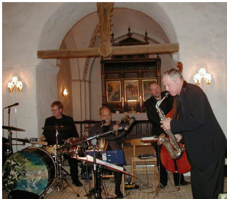
Jazzkvarteret Red Hot Four

Alle, der har tid og lyst til at deltage, er meget velkomne!